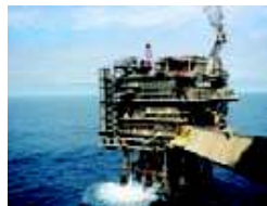
Volatilidade do crude está em queda, depois do máximo recorde em 2009.

E, afinal, à terceira não foi de vez. Os membros republicanos do Senado dos Estados Unidos voltaram a bloquear a discussão do projecto de reforma da regulação financeira. A ala republicana manteve-se unida contra os Democratas, que assim não conseguiram ter o mínimo de 60 votos necessários para iniciar a discussão. No entanto, de acordo com a Bloomberg, a sessão iria prolongar-se durante a noite tentando pressionar os Republicanos, podendo haver uma alteração na votação a qualquer altura.